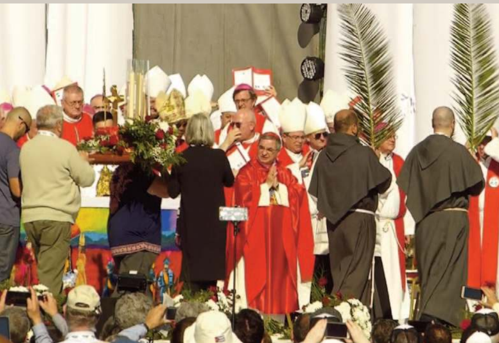
Celebración de la Beatificación, 27 abril 2019.

sobre sus problemáticas, organizaciones y proyectos. En Chamental, las comunidades celebraron la beatificación de sus curas, Longueville y Murias.