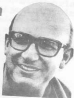
Memoria y Justicia

Cuando comenzamos a esbozar el proyecto del 30 aniversario lo hicimos pensando en algo realmente grande, y lo primero fue un "abrir la cancha", una apertura hacia grupos, organizaciones, instituciones, amigos, Jocistas y todo aquel que se sintiera motivado por la figura de nuestro Pastor. Cuando digo "nuestro", quiero que quede bien claro el "Pelado" es de todos, nadie puede arrogarse su propiedad, si bien es cierto que desde el Centro Tiempo Latinoamericano tratamos de mantener siempre encendida la llamita del mártir. Con toda humildad somos unos más entre tantas y tantos hermanos a lo largo y a lo ancho de Latinoamérica que mantiene vigente su testimonio de vida y estamos convencidos que se encuentra presente en cada grupo que trabaja por el bien común.