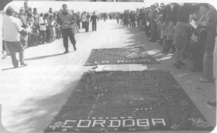
Celebración en la ruta, en Punta de Los Llanos.