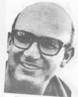
Memoria y Justicia

El Encuentro de Reflexión se desarrolló en el salón de Unión y Benevolencia de Córdoba. Participaron grupos y personas de Córdoba y otras provincias argentinas, así como amigos de Chile y Uruguay. Se recibieron adhesiones de obispos argentinos, latinoamericanos y de las iglesias hermanas.