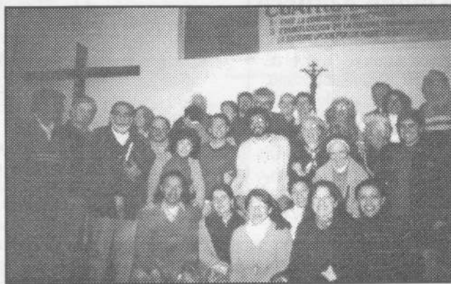
Participantes del taller, realizado en la Casa de la Catequesis y organizado por nuestro Centro Tiempo Latinoamericano.

Las situaciones de opresión, crisis y violencia son una oportunidad para recrear la esperanza. El P. Cisterna afirmó: "El egoísmo humano ha hecho problemática la existencia en un mundo en que reina la violencia que reviste