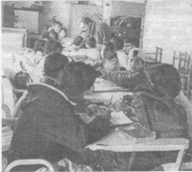
Apoyo escolar a 40 niños.