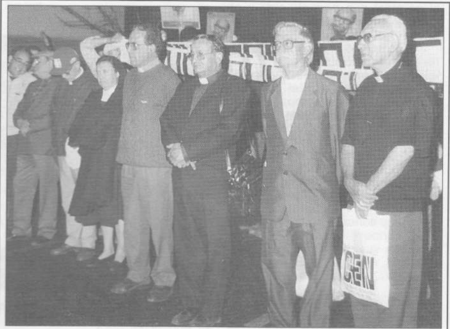
En los actos celebratorios de los 20 Años del martirio de Mons. Angelelli, participó un grupo de obispos latinoamericanos en representación de los 40 Obispos que anualmente se reúnen en el CESEP, San Pablo, Brasil.

"Una cosa es ver, otra cosa es entender y otra cosa es comprender una cultura. Distinguiendo estos tres aspectos en relación con la cultura, pues cuando nosotros vemos una cultura descubrimos factores culturales, cuando nosotros entendemos una cultura descubrimos relaciones entre los factores culturales, cuando nosotros comprendemos una cultura vemos la globalidad de la cultura y su utopía que tiene delante. Si alguien mirando ve una cultura y actúa la destruye. Si alguien entendiendo una cultura quiere entrar, modifica. Si alguien comprendiendo la globalidad quiere actuar entonces ya es parte de aquella cultura, la ha entendido y entonces no la modifica ni la destruye, sino la transforma. O sea, es parte del grupo humano entonces el avance es diferente. Son los propios miembros de la cultura los que penetrados de los valores evangélicos van