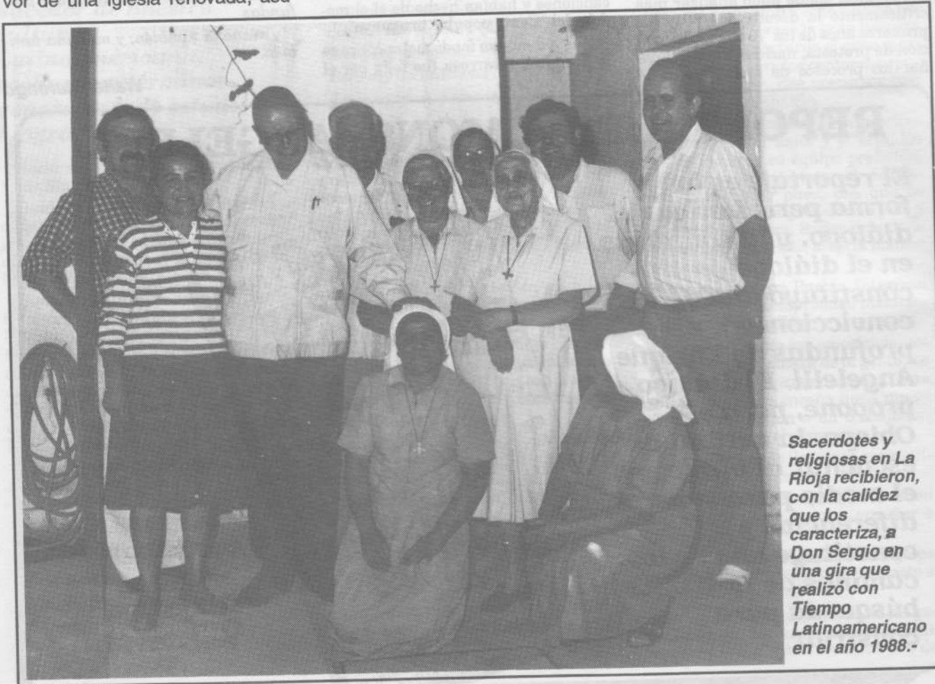
Sacerdotes y religiosas en La Rioja recibieron, con la calidez que los caracteriza, a Don Sergio en una gira que realizó con Tiempo Latinoamericano en el año 1988.-

El nombre de Don Sergio trascendió las fronteras mexicanas, cuando inició en su diócesis, al soplo del Espíritu que animaba la renovación del Concilio Vaticano II, una serie de cambios que incluyó la autorización para el uso del psicoanálisis en los conventos, lo que acarreó dificulta-