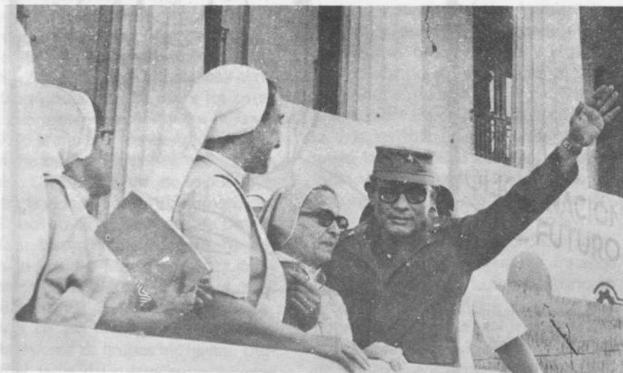
Tomás Borge, miembro de la Junta de Gobierno en la misma tribuna que las Religiosas. Entre Revolución y Religión no hay oposición.

Pero con atención especial, fui a aprender.