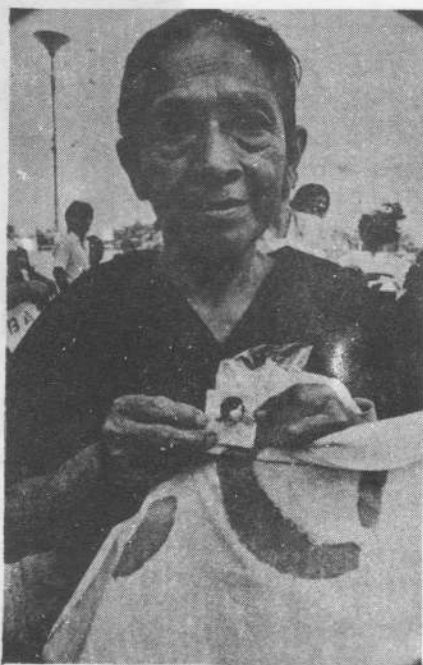
La alegría y el dolor se entremezclan en el rostro de una madre que entregó su hijo por una Nicaragua Libre.

El pueblo está consustanciado con su revolución: la ama profundamente y la defiende y la defenderá hasta la muerte. Por eso, poco a poco, el pueblo va recibiendo todo lo que antes se le negó y era suyo. El anhelo es entregar TODO el poder al pueblo. Y por eso, el gobierno sandinista —ante el criminal ataque exterior por tierra, aire, y mar— obligado por esta circunstancia no querida, no teme ir entregando TODAS LAS ARMAS al PUEBLO. El defiende su revolución. Ernesto y su pueblo, aman profundamente la paz. No quieren ni la violencia ni las armas. Sólo por esta dura y costosa imposición las tiene en sus manos. No son belicistas. Ernesto lo dice, y se respira en toda Nicaragua: hay ansias de Paz. In-