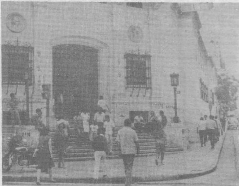
"Más de 17.000 estudiantes aspiran a ingresar a la U.N.C., sólo 4.700 lograrán su objetivo".

"Este tipo de educación —decían los Obispos en Medellín— es responsable de poner a los hombres al servicio de la economía, y no ésta al servicio del hombre. Los métodos didácticos, están más preocupados por la transmisión de los conocimientos que por la creación de un espíritu crítico. Desde el punto de vista social, los sistemas educativos están orientados al mantenimiento de las estructuras imperantes, más que a su transformación. Es una educación uniforme, cuando la comunidad latinoamericana ha despertado a la riqueza de su pluralismo humano; es pasiva, cuando ha sonado la hora para nuestros pueblos de despertar su propio ser, plétóricos de originalidad; está orientada a sostener una economía basada en el ansia de 'tener más', cuando la juventud latinoamericana exige 'ser más', en el gozo de su autorealización, por el servicio del amor". (Medellín—Educación, 1-3)