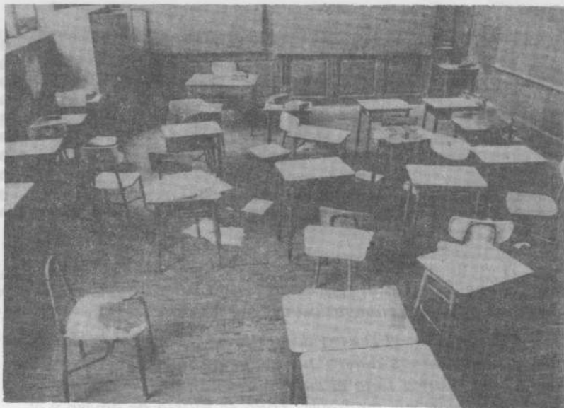
En ésta Universidad restrictiva y elitista, las aulas vacías son una irritante realidad del hoy argentino.

Aquella conciencia participativa del estudiantado se expresa hoy en loables iniciativas de distintos agrupamientos que bregan por cambiar