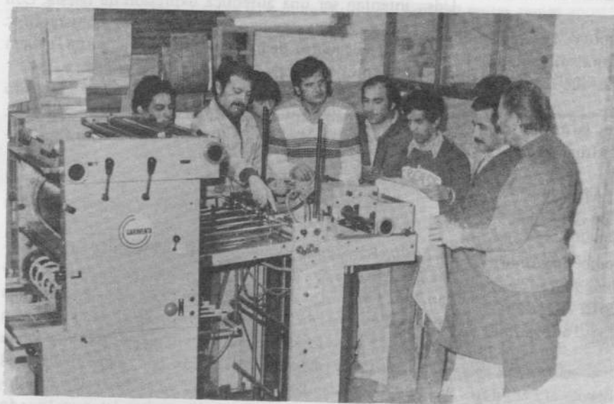
Cursos de Capacitación en Artes Gráficas que se realizan en talleres gráficos de la Universidad Nacional de Córdoba

La Fundación se mantiene por aportes que realizan empresas adheridas a las entidades fundadoras, a través de las posibilidades que les otorga la ley 22317, Ley de Certificados de Crédito Fiscal, es decir, que las empresas que aportan a la Fundación, degravan algunos impuestos del Estado, apoyando de ese modo una tarea que crece con esfuerzo e imaginación.