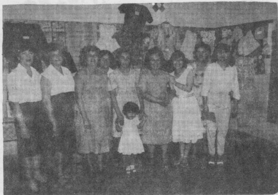
Algunas colaboradoras del Equipo del Padre Juan. . . Un cartel preside la exposición. "Estuve desnudo y me vestisteis"