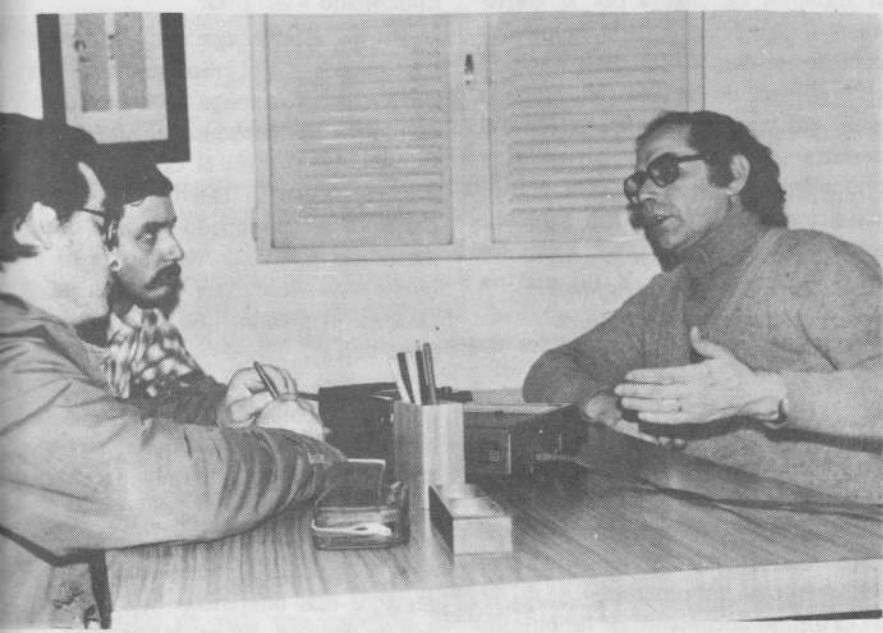
Tempo Latinoamericano abre el surco para que las palabras fructifiquen en un futuro mejor.

de donde provienen. Yo siempre digo que no tengo tiempo para contestarlos porque hay cosas mucho más importantes para hacer.