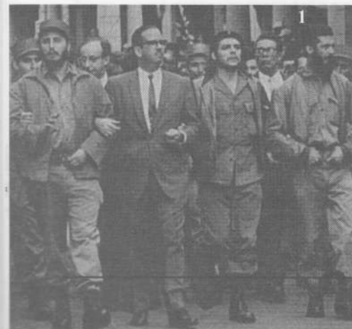
1. Marcha en Cuba, 2. Kennedy, 3. Colombia, 4. Praga, 5. Helder Cámara, 6. Mayo Francés.