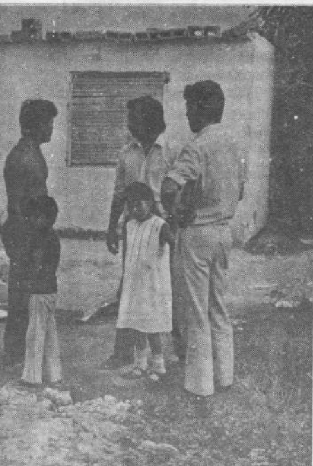
sa realidad. Con su acción constante a del barrio.

—Hace poco nos conocemos y apoyamos por ahora la obra social de la Capilla. Atendemos una pequeña guardería en las horas de misa. El año pasado cultivamos huertos en las casas de la gente más humilde. Algunos trabajamos en apoyo escolar a los chicos más atrasados de la escuela primaria. Son sinceros y han tenido la suerte de beber la religión en estas fuentes del compromiso cotidiano. El trabajo social, para ellos no es un mero "temporalismo", sino una respuesta encarnada a sus hermanos humildes. . .